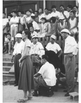
Setsuko Hara et Yasujiro Ozu sur le tournage de Voyage à Tokyo

Ozu éternel contemporain / réalisé par Jean-Pierre Jackson. - Paris : CNC, 2006. - 1 DVD, Couleur, 52mn. - (Cinéma) - Date du film : 2003