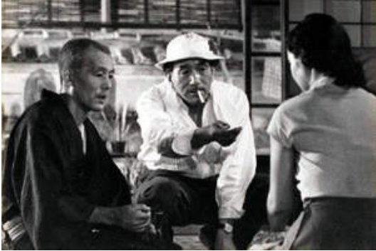
Sur le tournage de Voyage à Tokyo (1953)

« Né à Tokyo, dans le quartier de Furukawa, près de l'enceinte d'un temple, Ozu est le cadet d'une famille de cinq enfants dont le père est grossiste en engrais. Il a douze ans quand sa mère s'installe avec ses enfants à Matsusaka, village natal du père, près de Nagoya. Le père, lui, demeure à Tokyo pour son commerce, et cette absence marque l'adolescence d'Ozu.