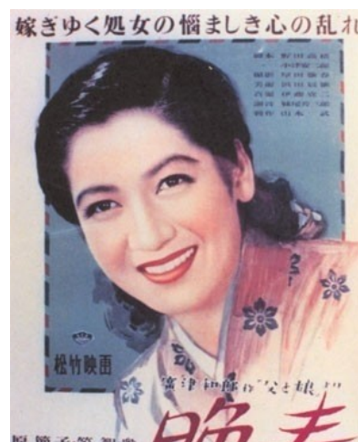
Affiche du film Printemps tardif