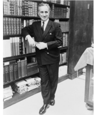
Elia Kazan

À l'origine, l'Actors Studio a pour fonction de permettre à des comédiens confirmés de perfectionner leur art dans l'intimité d'un atelier, sans la pression d'un tournage.