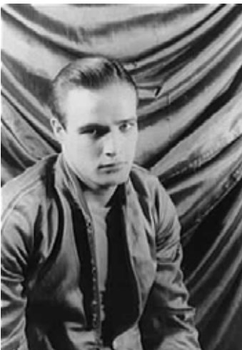
Marlon Brando

Tandis que les premiers écrits de Stanislavski privilégiaient une identification physique et psychologique totale de l'acteur avec son personnage, Lee Strasberg estime que le comédien doit faire exister son personnage, le rendant capable par différents exercices de recréer tout ce qu'il y a à recréer afin de vivre vraiment des circonstances imaginaires à travers sa mémoire affective, répondant à la question : "qu'est ce qui me motiverait pour réagir comme le rôle ?", ou d'autres pratiques comme la substitution, le geste psychologique... : l'acteur doit puiser en lui-même émotions et affects. Ce processus laisse une totale liberté à l'acteur "free will" dans le moment, et donne naissance à un jeu organique, toujours basé sur la vérité.